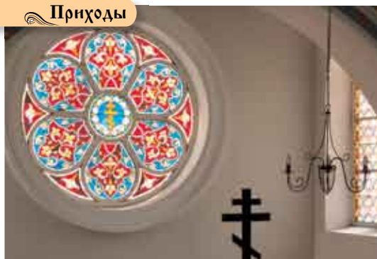
Пржеров, храм свв. Кирилла и Мефодия