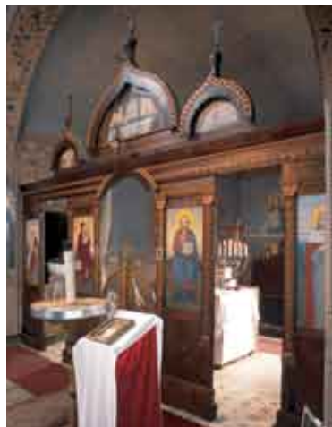
Тржебич, храм свв. Вячеслава и Людмилы