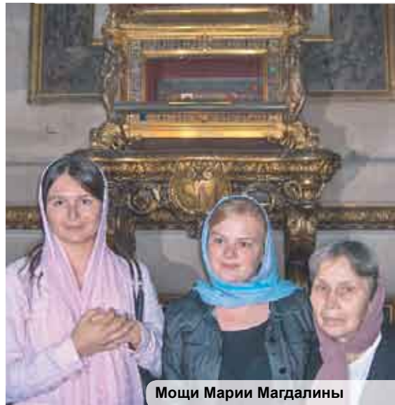
Мощи Марии Магдалины

Гонения на христиан в Галлии, как и всюду, продолжались до 312 года; но истребить христианство языческому Риму не удалось. Несмотря на гонения, Православная Галльская Церковь продолжала расти численно и духовно и дала много мучеников и святых, как вселенского, так и поместного значения. Среди них: св. Ириней Лионский, основоположник богословия восточной традиции, сщмч. Дионисий Ареопагит, свв. мученики Рустик и Елевферий, прославленный борец против арианства св. Иларий и апостол Галлии свт. Мартин Турский, св. Маркелл и множество других. К святым, просиявшим в Православной Галльской Церкви, относится и покровительница Парижа преподобная Геновефа (во французском произношении — Женевьева).