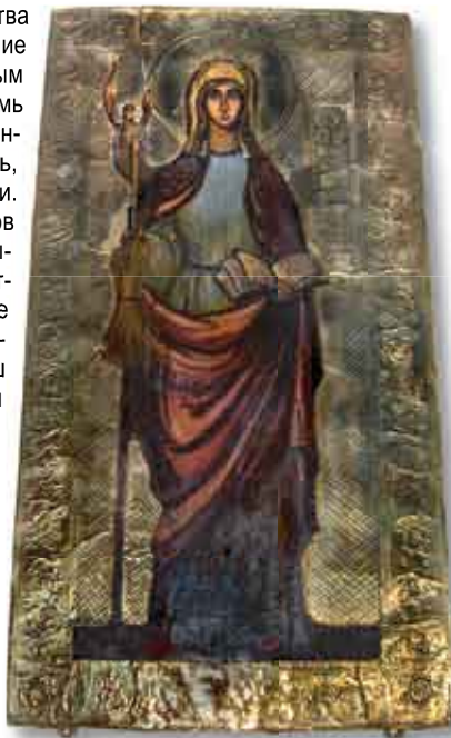
Первая православная икона Женовьевы Парижской, находящаяся в Трехсвятительском подворье

Проповедь христианства в Галлии (древнее название Франции) восходит к первым векам, когда возникли семь епархий современной французской провинции Бретань, основанные семью святыми. Нашествие языческих саксов на Британские острова вынудило переправиться бриттов, которые в большинстве своем были православными, через пролив Ла Манш и основать в западной Франции первые приходы и монастыри. Произошло это в V—VI веках, а первые письменные свидетельства о христианских общинах на территории современной Франции относятся ко II веку. В 177 году за веру пострадали в городе Лион 43 мученика, о чем подробно написал святитель Ириней Лионский в своем письме. После этого христианство было проповедано во всех