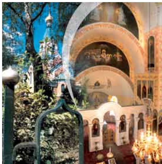
Оломоуц, храм св. Горазда