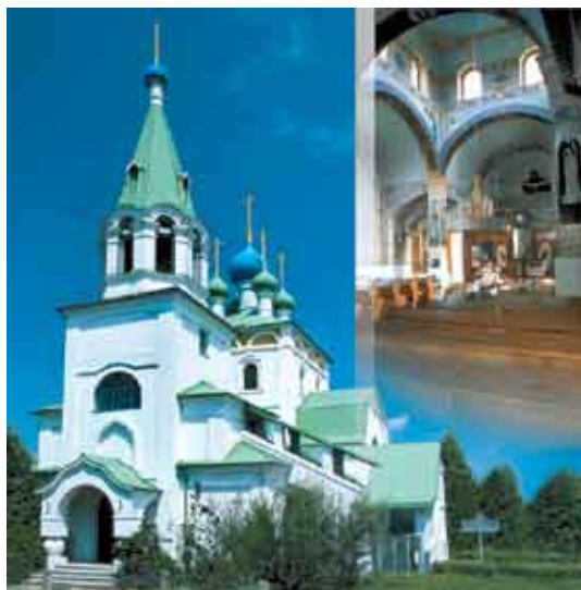
Худобин, храм свв. Кирилла и Мефодия