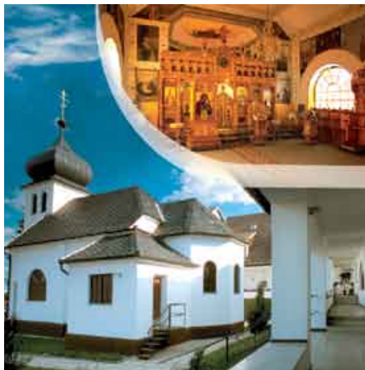
Вилемов, храм Успения Пресвятой Богородицы