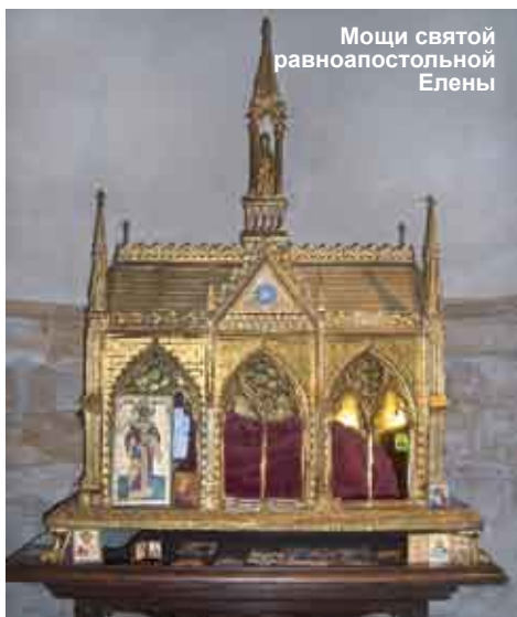
Мощи святой равноапостольной Елены

По материалам официального сайта Белорусской Православной Церкви