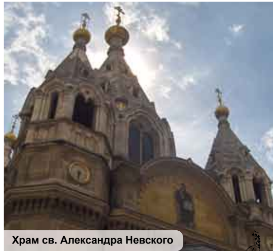
Храм св. Александра Невского