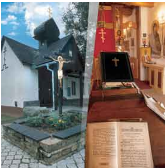
Груба Врбка, монастырь св. Горазда