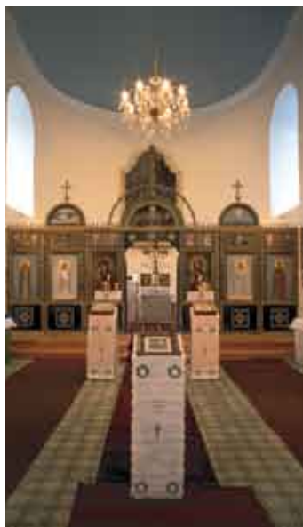
Опава, храм св. Елизаветы