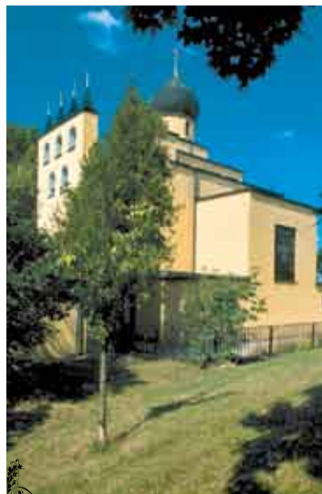
Брно, храм св. Вячеслава