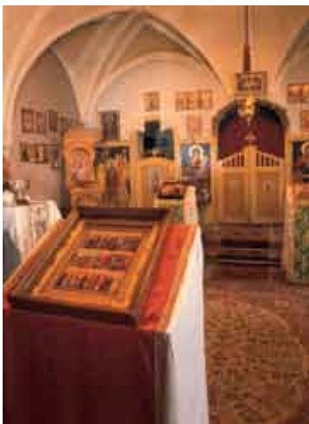
Йгглава, часовня свв. Вячеслава и Людмилы