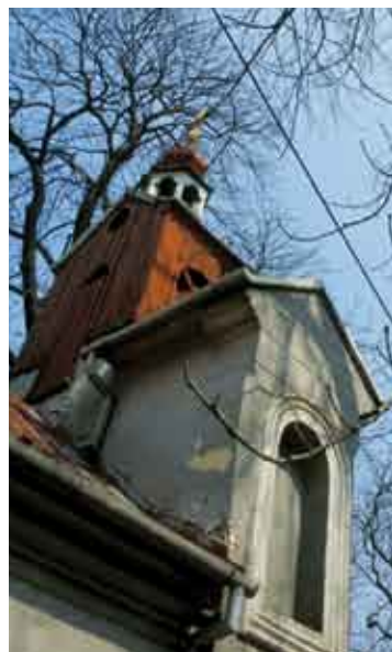
Острава – Пустковец, храм Ангелов Хранителей