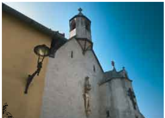
Зноймо, храм св. Вячеслава