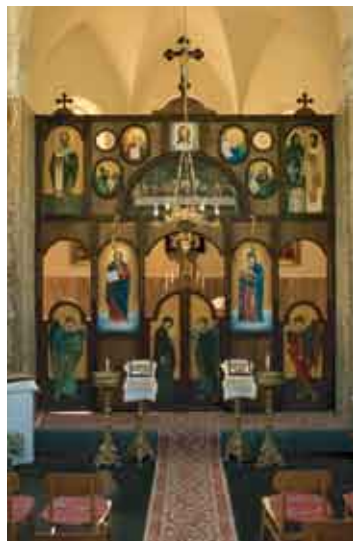
Уничов, храм Воскресения Христова