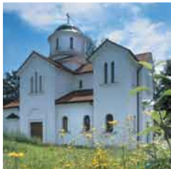
Шумперк, храм Святого Духа