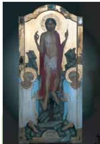
Долни Коунице, храм св. Варвары