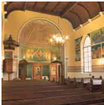
Микулов, храм св. Николая