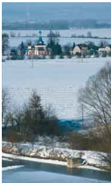
Ржилице, храм св. Людмилы