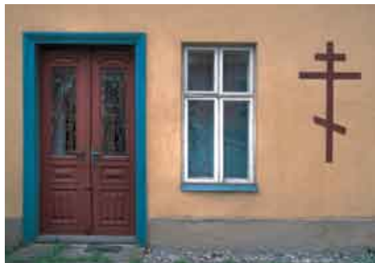
Либина, храм св. апостола Иакова