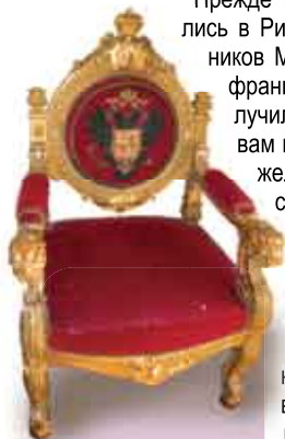
Кресло - трон царя Николая II, находящееся в здании бывшего посольства РФ во Франции

Его поступок не получил единодушного одобрения. Когда монах принес похищенные мощи в свой монастырь, в их подлинность не поверили и похитителя осмеяли. Чтобы его разоблачить по всем правилам, была организована экспедиция в Рим, и результатами своего посольства французские монахи остались довольны. Но король