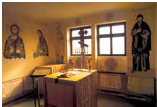
Ярославце, храм св. Иосифа Обручника