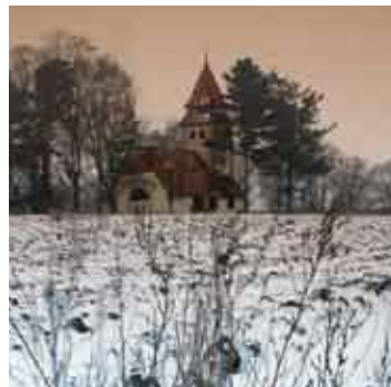
Судице, храм св. Вячеслава