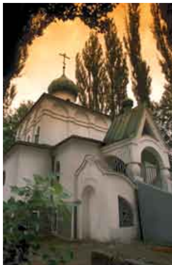
Кромержиж, храм свв. Кирилла и Мефодия